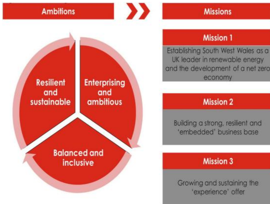
Ffigur 1: CCERh – Uchelgeisiau a Nodau

hamgylchedd erbyn 2050. Un nod yw gwneud De-orllewin Cymru yn arweinydd yn y Deyrnas Unedig ym maes ynni adnewyddadwy, gyda ffocws ar ddatgarboneiddio arloesi a datblygu'r gadwyn gyflenwi ym maes diwydiant. Mae ymateb i her yr hinsawdd wrth wraidd ein gweithredu ac yn elfen o bob un o'n nodau strategol, gan sicrhau ffocws ar yr economi werdd; tai a thrafnidiaeth cynaliadwy; a sicrwydd ynni.